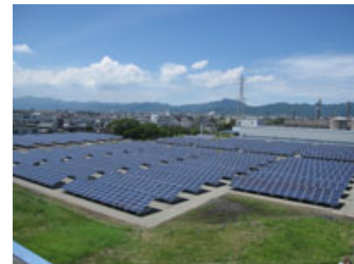
徳島事業所内メガソーラー