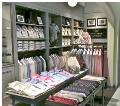
蝶矢シャツ グランフロント大飯店