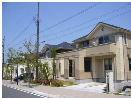
旧針崎工場(愛知県岡崎市)再開発地