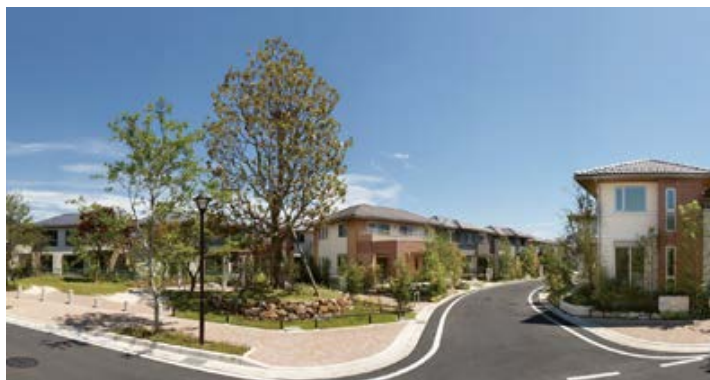
旧川越工場(埼玉県川越市)再開発地