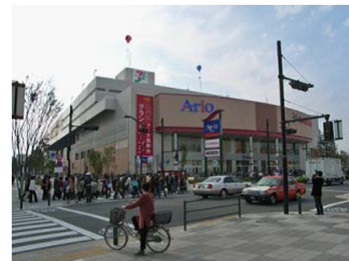
旧西新井工場(東京都足立区)再開発地