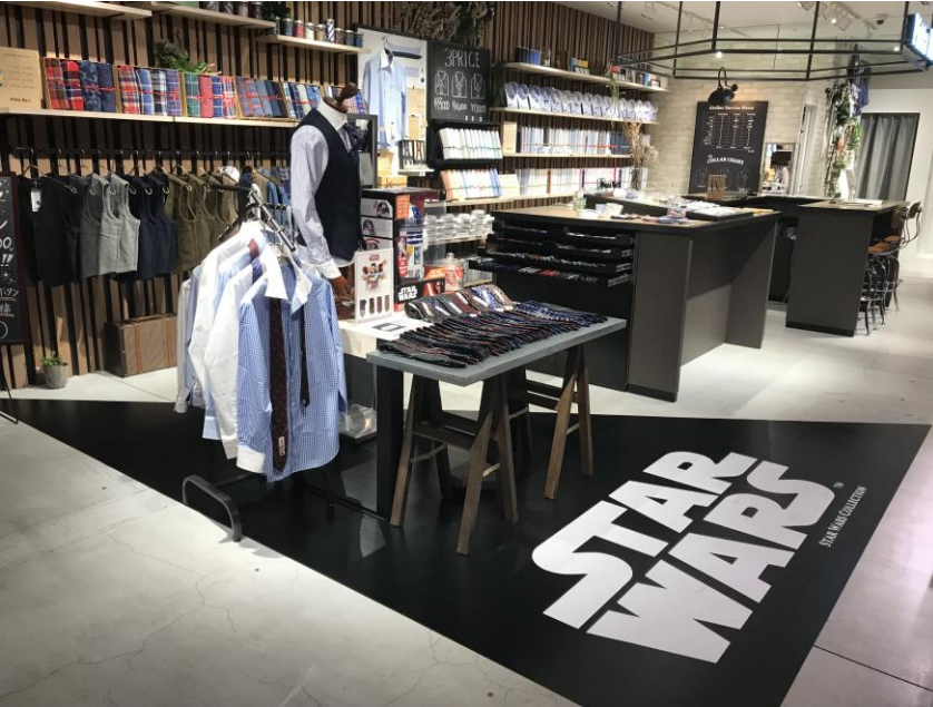
※期間限定 Pitta Re:)店内写真